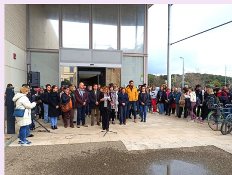
Lectura en el Campus de Huesca