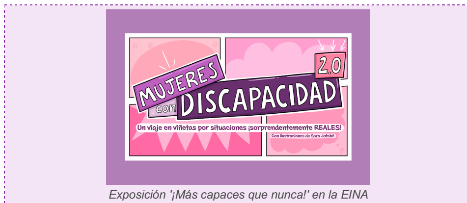
Exposición '¡Más capaces que nunca!' en la EINA