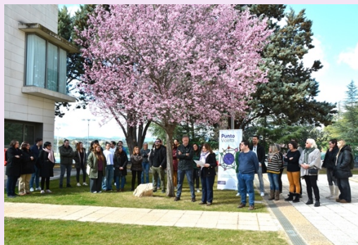
Lectura en el Campus de Teruel