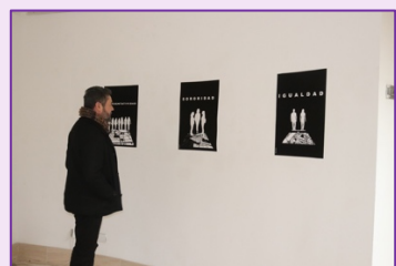
Obras de videoarte exhibidas