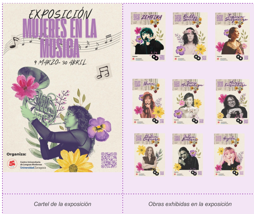
Cartel de la exposición

Es un proyecto cultural del curso 2025-26 en el que participan las distintas secciones lingüísticas del Centro.