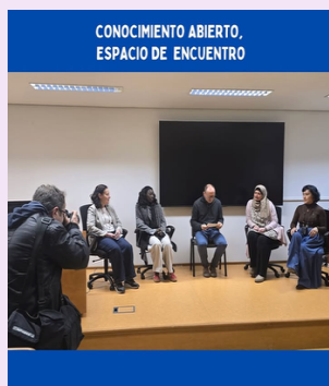
Mesa redonda 'Igualdad y Migración'. Escuela Politécnica Superior, Huesca

Diálogo participativo sobre experiencias migratorias femeninas. Sala de Grados de la Escuela Politécnica Superior.