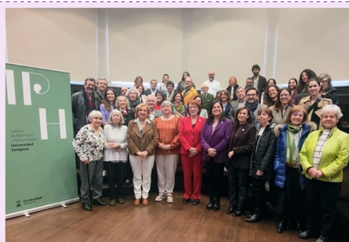
Sala Pilar Sinués, Paraninfo