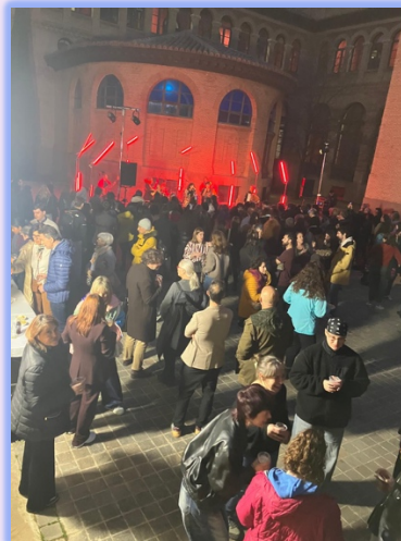
Ambiente en el concierto del 4 de marzo