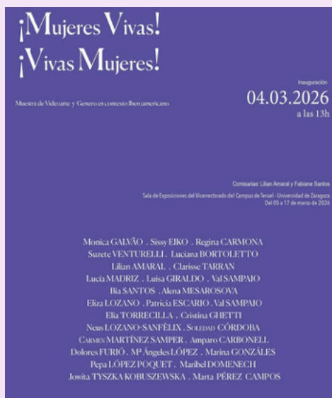
Cartel de la exposición en Teruel

Muestra Internacional de Videoarte y Género en Contexto Iberoamericano. Sala de Exposiciones del Vicerrectorado. Inauguración 4 de marzo, 13:00 h.