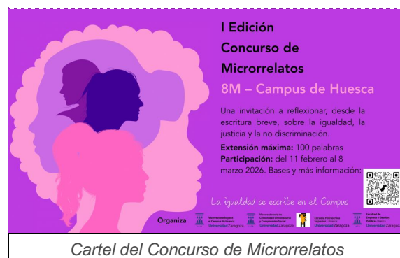
Cartel del Concurso de Microrrelatos

Convocatoria en colaboración con centros universitarios y Vicerrectorados de Huesca y Comunidad Universitaria y Compromiso Social.