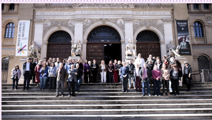
Lectura del Manifiesto en el Paraninfo

Simultáneamente en Escaleras del Paraninfo, Campus San Francisco, Campus Río Ebro, Campus de Huesca y Campus de Teruel.