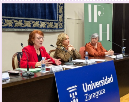
Presentación de la base de datos MAR

'Mujeres en Aragón, 1800-1970. Ciencias Humanas y Sociales'. Instituto de Patrimonio y Humanidades (IPH).