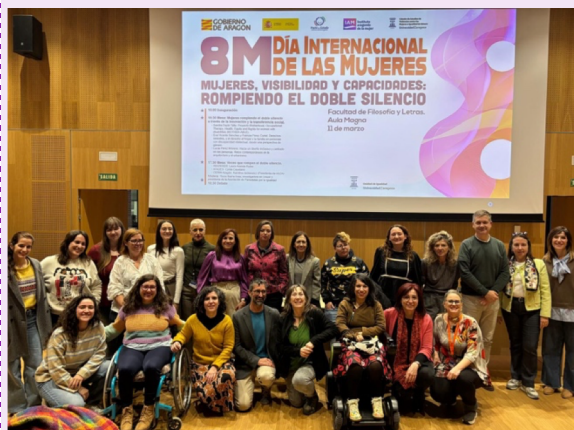
Ponentes y entidades sociales