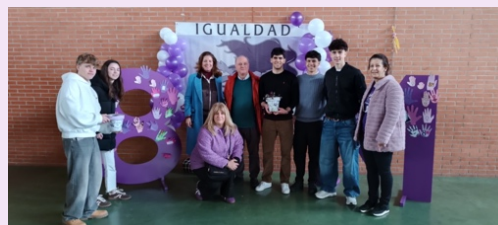
Acto 'Sembrando Igualdad'. EUPLA, La Almunia de Doña Godina.