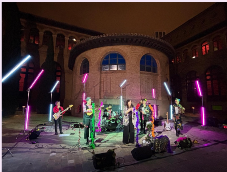
Concierto CumbiaZepam — Patio Paraninfo

Cierre musical festivo de la jornada inaugural. Celebración colectiva del Día Internacional de las Mujeres.