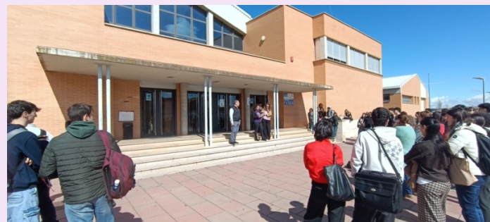
Lectura del Manifiesto en el Paraninfo